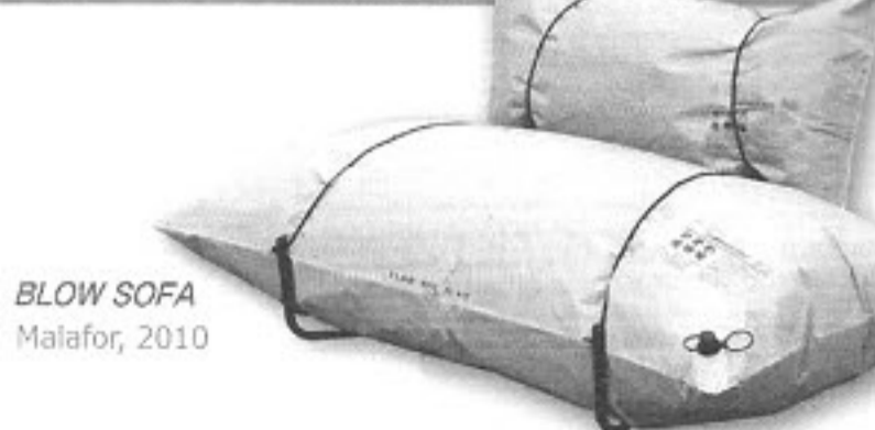
BLOW SOFA Malafor, 2010