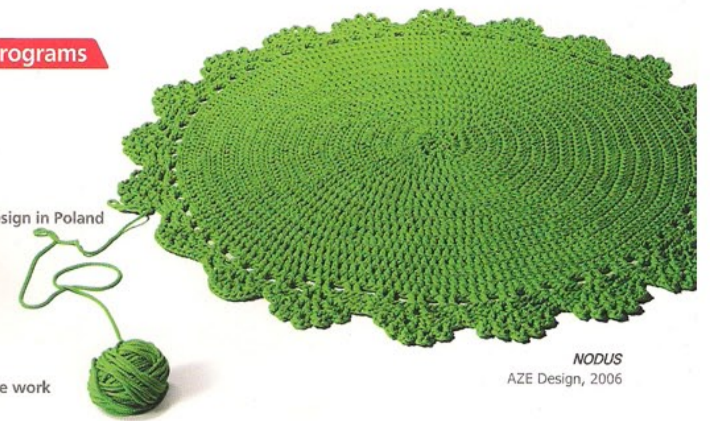
NODUS AZE Design, 2006

* 본 강좌는 한국어로 진행됩니다. | Lectures are given in Korean.