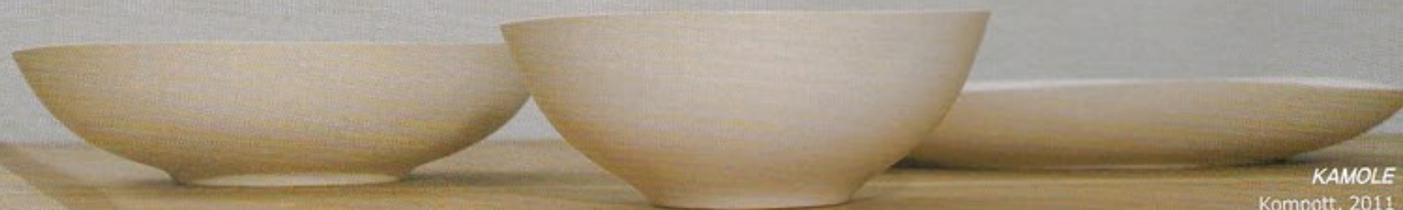
KAMOLE Kompott, 2011

This August, the UNPOLISHED exhibition will be sharing a glimpse of contemporary Polish design. Sixteen designers and design groups present work that is clever and original, made with things that can be found all around in our everyday life. A range of other programs are available for visitors to delight in Poland's unique art and culture, including a curator's talk, a designer's talk, lectures, and film screenings.