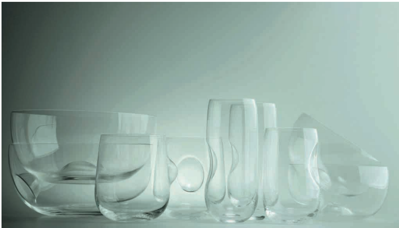
Na palec – kolekcja szkła użytkowego, proj. Agnieszka Bar

tenerów, które nie są nakładane na pojazd, ale podwieszane 30 cm nad powierzchnią ziemi. Praca została nagrodzona wyróżnieniem na ubiegłorocznym konkursie VDA Future Road Transport 2020, 13 Biennale Młodych Artystów z Europy i Krajów Śródziemnomorskich oraz otrzymała wyróżnienie za najlepszy dyplom akademicki 2006/2007 na rodzimej uczelni projektanta, czyli na Wydziale Architektury Wnętrz i Wzornictwa wrocławskiej ASP.