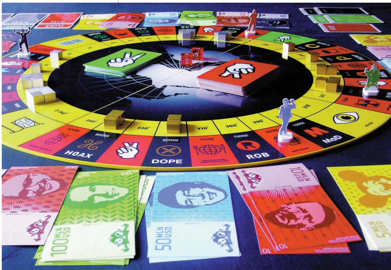
Nowy wspaniały świat – gra planszowa, proj. Krzysztof Ignasiak

Szczególne zainteresowanie wzbudzają projekty środków transportu, jak futurystyczne i aerodynamiczne w kształcie ciężarowe auto Muskulös zaprojektowane przez Bogusława Parucha. Pojazd ten odrzuca tradycyjne rozwiązania, w których towary są załadowywane i wyładowywane za pomocą wózków widłowych bądź innych niezbędnych urządzeń. W tym wypadku ciężarówka przeznaczona jest do przewozu kon-