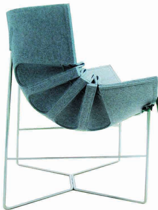
Fałdy, bufy, plisowanie – fotele z filcu, proj. Monika Elikowska-Opala